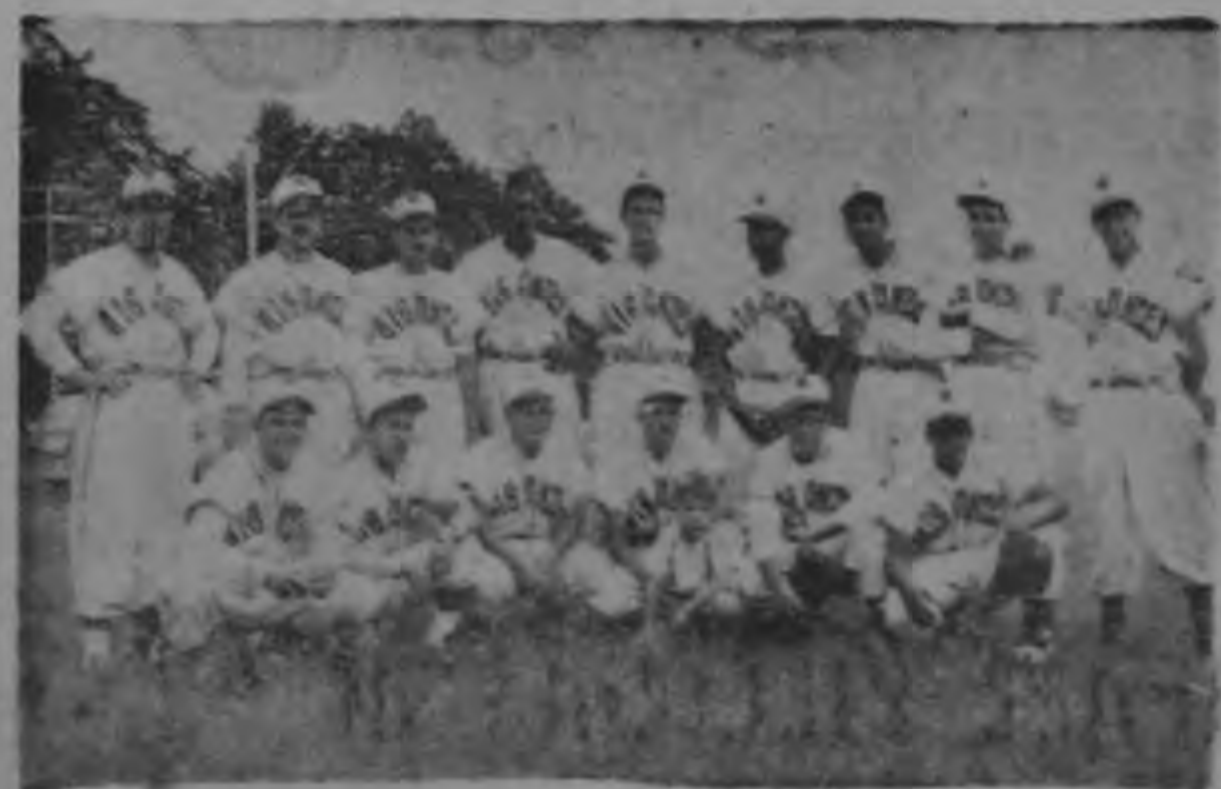
La novena GIGANTES terminó invicta su actuación de la primera vuelta del Campeonato de Beisbol capitalino, derrotando el domingo en forma indiscutible al NUEVE ESTRELLAS por siete carreras contra 2. Lucen en gran forma.