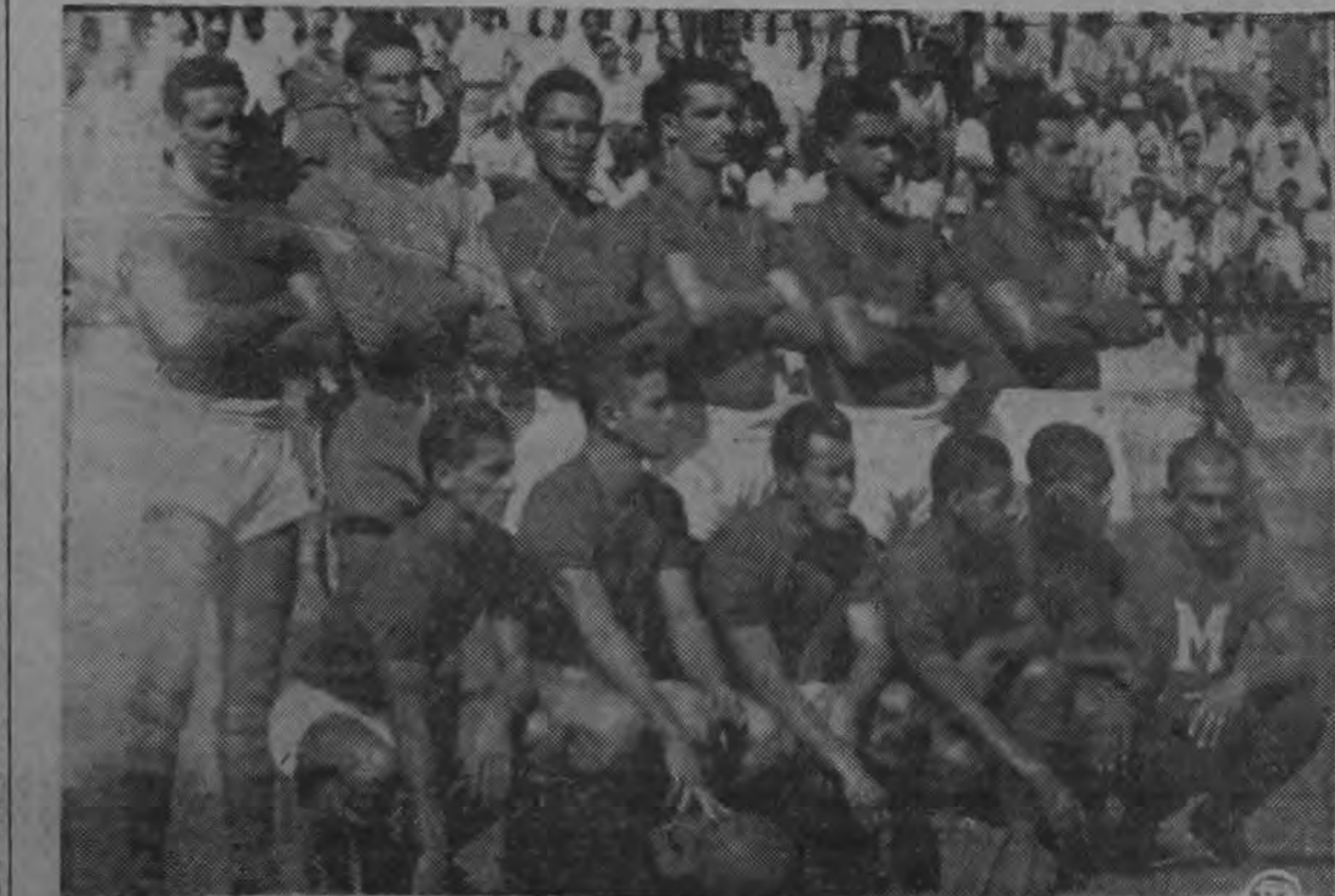
El equipo brasileño Bonsucesso terminó invicto su campaña en Guatemala derrotando el domingo al Municipal, Campeón Nacional, por el escandaloso marcador de siete tantos contra uno. Anteriormente había vencido al Aurora por tres a cero y al Comunicaciones por dos a cero. Al igual que en El Salvador los suramericanos no llegaron a perder ni empatar un solo partido