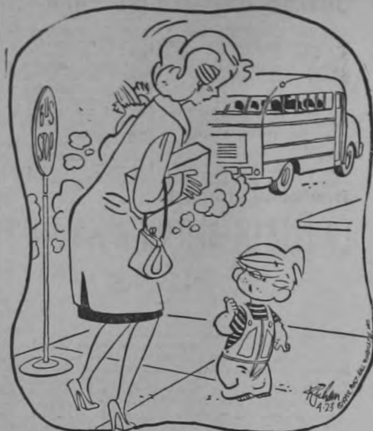
¿Mis zapatos y mis medias? Las deje en el bus. ¿Por que?