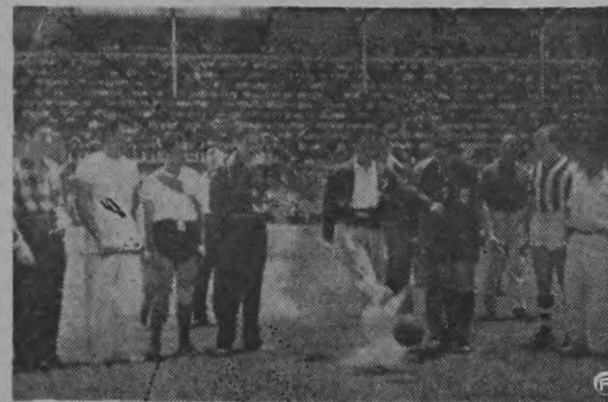
El partido entre florentinos y libertos se jugó en honor de las Delegaciones de Nicaragua, El Salvador y Curazao que ya se encontraban en el Estadio y que tomarán parte en el VII Congreso Centroamericano de Arbitros de Fútbol. Aquí los vemos en el centro de la cancha cumpliendo con el saque de honor.