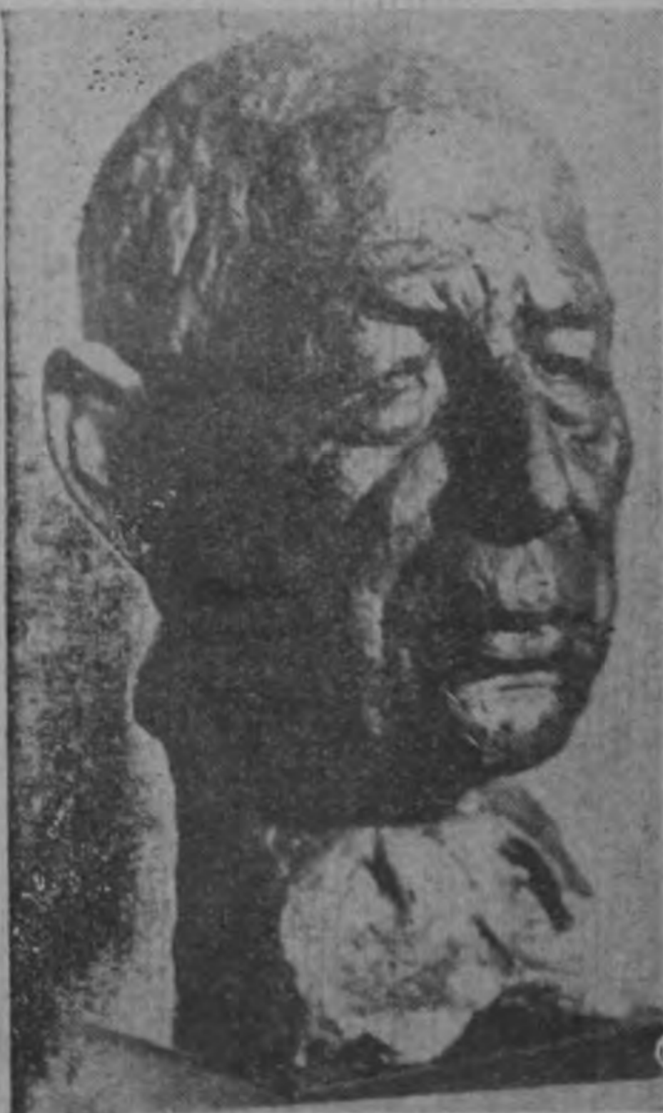
EMILIANO CHAMORRO. —El discutido político nicaragüense, hoy prisionero. Un poco chorotega, otro poco granandano. Edith Gron ha puesto en esta escultura cierta dolorosa gravedad. La cabeza de Chamorro, hoy prisionero, a los ochenta y cinco años de edad, presenta un aire de fuerte resignación.