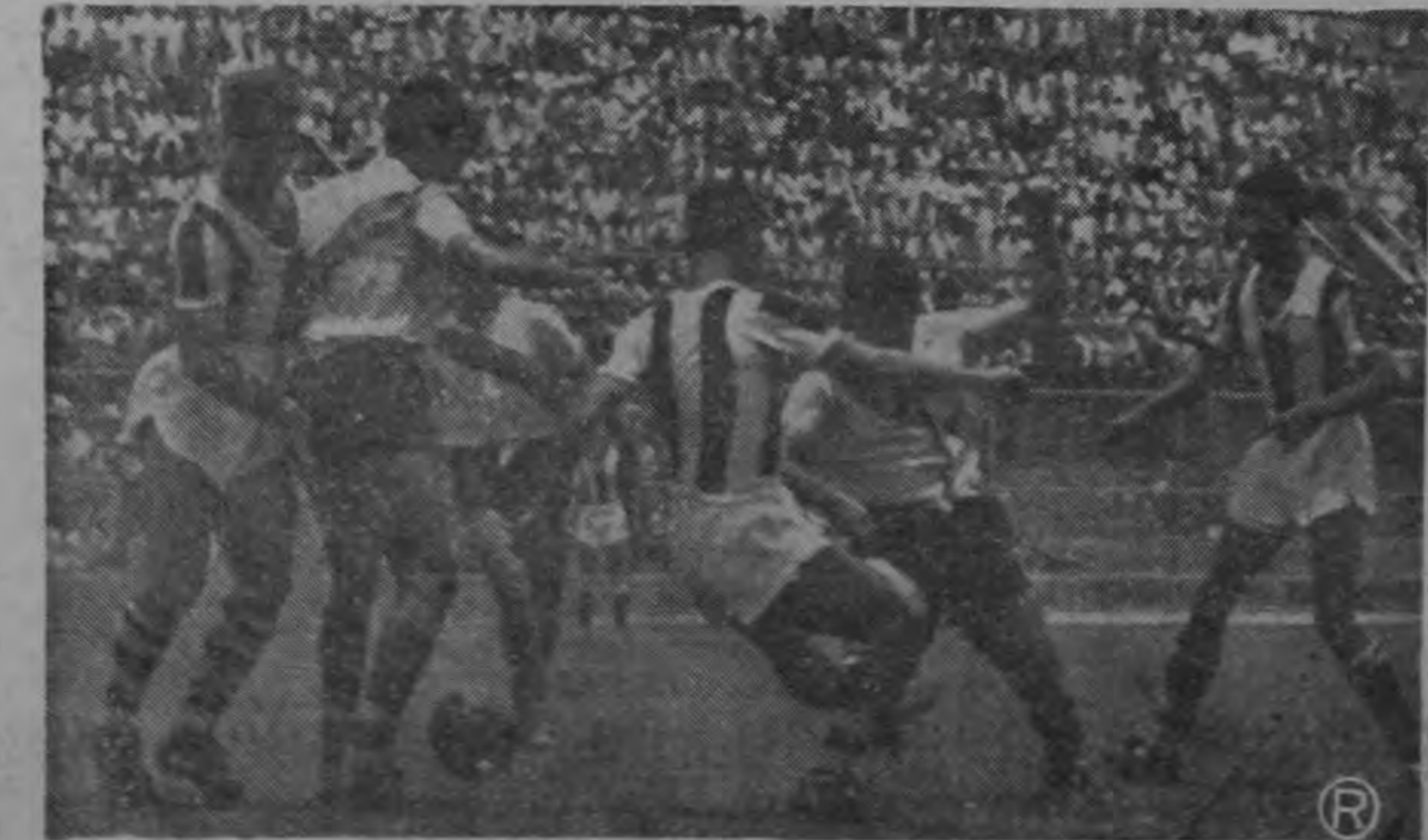
Puede verse en esta gráfica a los delanteros florenses accionando en forma incontenible, mientras que la defensiva liberto se esfuerza por detenerlos. Los heredianos, más homogéneos y efectivos, lograron anidar cuatro veces el balón en la cabaña decana, llegando así invictos al final de la primera vuelta.