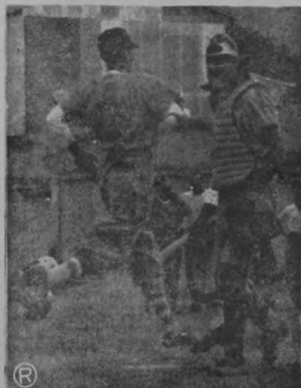
Esta fue una de las tres carreras anotadas por el Canada Dry. El que entra a home es William Zamora. Sin embargo, no fueron suficientes para alcanzar a sus rivales. El Caribe se impuso por 5 carreras contra 3, en el juego estelar del programa beisbolístico del domingo en el Parque Escarré.