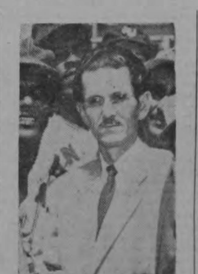
Por RAMÓN COLL J.

Los europeos, como siempre, llevan la mejor parte, pues clasifican, en las eliminatorias nueve, y